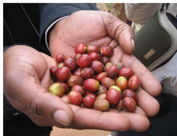
Kaffee-Kirschen der Ernte 2012